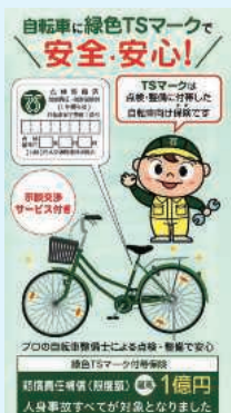
緑色TSマークパンフレット

10月23日神戸市中央区ラッセホールにおいて、(公)日本交通管理技術協会主催の令和6年度自転車安全整備制度推進ブロック会議が開催されました。 近畿管区警察局及び兵庫県警察本部から来賓を招いて、滋賀、京都、大阪、奈良、和歌山及び兵庫の二府四県から、交通安全協会の専務理事や自転車軽自動車商業共同組合の理事長等が一堂に会して、自転車の安全整備制度をはじめTSマーク普及拡大事業推進を協議しました。特に自転車の点検整備に付帯する緑色TSマークは、全ての人身事故に対応した最高1億円までの賠償責任補償が付き、さらに示談交渉サービスが付加された有用性の高い保険であることから、普及拡大に向けて取組んでいくことを話し合いました。