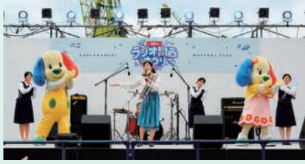
広報大使天宮遙さんが歌いました