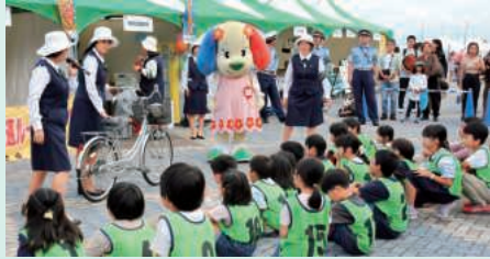
自転車の点検を学びました