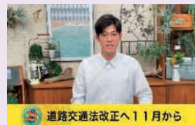
道路交通法改正へ11月から罰則強化を解説