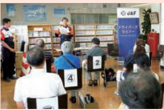
JAFドライバーズセミナー

JAFでは、ベテランドライバーを対象に、ドライバーズセミナー「シニアコース」を開講しています。プロの指導員が基礎から教えてくれるよい機会です。冷静なプロドライバーの目から見ると、不自然な姿勢や動作はすぐわかります。また、自分自身で、ほかのドライバーと比べることが、見えてくることがあるかも知れません。クセや身体能力の変化を知ることが大切です。今のうちに自身の運転技術を見直して、一生安心できる安全運転を身に付けましょう。