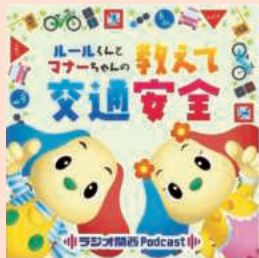
ポッドキャストの番組パネル