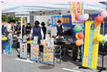
交通安全協会ブース