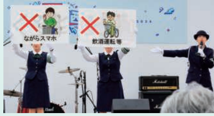
罰則強化を解説しました