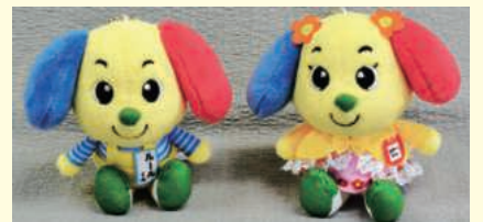
ぬいぐるみのルールくんとマナーちゃん