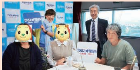
ラジオ関西スタジオで収録しました