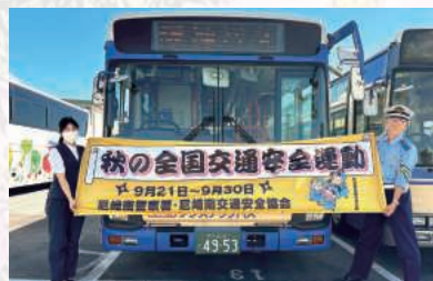
阪神バス(株)浜田車庫

9月11日尼崎市大庄阪神バス(株)浜田車庫において、秋の交通安全運動に伴い、路線バスの中刷り広告に、落第忍者乱太郎たちのイラストが付いた交通安全ポスターを掲出したバスが披露されました。