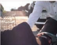
神戸芸術工科大学

兵庫県と交通安全協会は、県内の芸術系大学・専門学校と協働で、若者・Z世代に向けた自転車ヘルメット着用促進動画を作成しました。