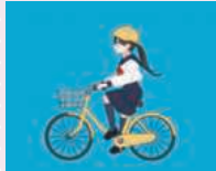
専門学校アートカレッジ神戸