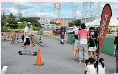
電動キックボード体験

9月23日伊丹市池尻阪神自動車学院において、伊丹交通安全協議会が交通安全フェスタを開催しました。