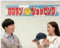
大阪芸術大学短期大学部