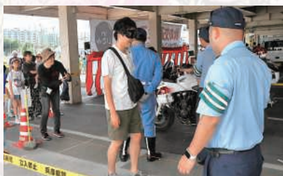
飲酒状態体験ゴーグル

白バイや阪急バスの展示には、たくさんの家族連れが集まり、EV(電気自動車)や電動キックボード試乗会、飲酒状態体験ゴーグルなどの交通安全コーナーが設けられました。緑日のように金魚すくいや綿菓子、焼きそばの店も出店され、子供たちは楽しく交通安全に親しむことができました。