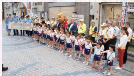
園児による歌の披露

園児らは、水道筋交番前で歌を披露、「交通安全宣言」を読み上げ、買物客等に交通安全啓発グッズを配布して、交通安全を呼びかけました。