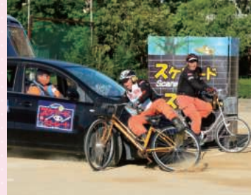
ヘッドホン使用自転車の衝突