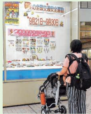
県広報ショールウインドー

9月18日から29日まで、秋の全国交通安全運動に合わせて、神戸市中央区兵庫県広報ショールウインドー（市営地下鉄市前駅構内）に各地区交通安全協会婦人部・女性部等が工夫を凝らして製作した手作り交通安全グッズを展示して、地下鉄等利用者に見ていただき、交通安全意識の高揚を図りました。