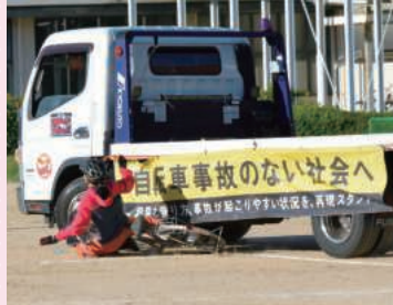
トラックの左折巻込み衝突