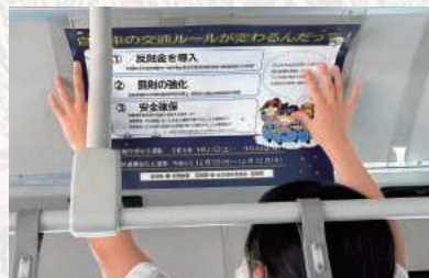
道路交通法改正ポスター

9月11日尼崎市大庄阪神バス(株)浜田車庫において、秋の交通安全運動に伴い、路線バスの中刷り広告に、落第忍者乱太郎たちのイラストが付いた交通安全ポスターを掲出したバスが披露されました。