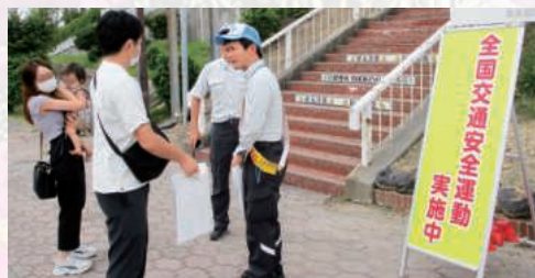
第二神明道路明石SA

兵庫県高速道路交通安全協議会(会長塚本哲夫)は、秋の全国交通安全運動期間中、県警高速道路交通警察隊及び道路管理者等とともに交通安全キャンペーンを実施、啓発チラシ等を配布して、重大事故に直結するあおり運転等の危険性や落下物の防止を呼びかけました。